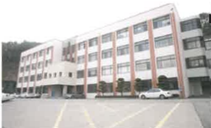
韓民族教育文化院