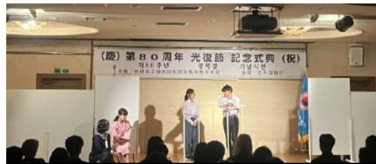
塩釜高校演劇部の演劇公演「Love & Peace」

民団宮城は今回の光復節記念式のような行事を通じて、海外居住の韓国人、そしてその次の世代が故国の歴史と民族意識を継続できる大きな共同体の空間としてその役割を続けていきます。(事務局 李江鉉)