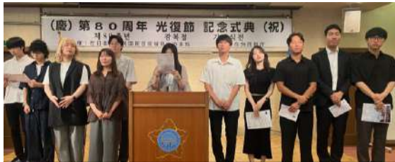
宮城韓国青年会、 次世代在日同胞のスローガン斉唱

80年前の光復の喜びを記念するための行事がここ、在日本大韓民国民団宮城県地方本部でも100人を超える在外同胞や韓日関係者が参加した中で、1、2部行事として韓国会館6階で