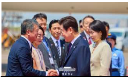
李在明大統領夫妻(右)と金利中団長(左) 23日、羽田空港

就任後の初外遊先として日本を訪問した李在明大統領は8月23日、「在日同胞午餐懇談会」を皮切りに1泊2日間の公式日程をスタートした。帝国ホテル東京本館で開かれた「在日同胞午餐懇談会」には、民団幹部らを中心に約200人の在日同胞が招待された。