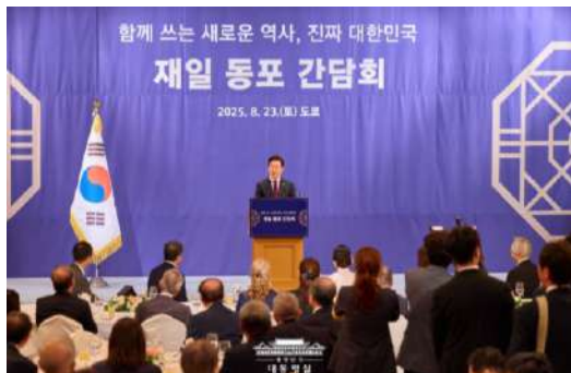
李在明大統領 23日

参加者を代表してあいさつした民団中央本部の金利中団長は光復節に大統領が発表した在日同胞への特別メッセージを言及し「在日の犠牲と献身を評価していただき大変感謝している。これからも在日韓国人の人権擁護と韓日