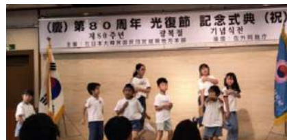
ハングル学校宮城学生たちの K-POP ダンス発表会