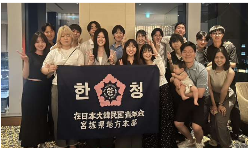
8月15日、ウェスティンホテル仙台、第2回民団宮城成人者同窓会