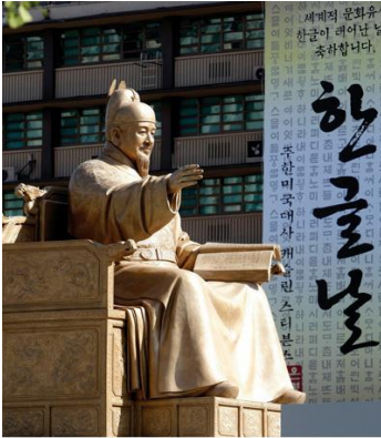
올해 한글주간 행사는 한글을 만든 세종대왕의 업적을 기리고 한글이 가지고 있는 소용과 아름다움의 가치를 자유롭게 느낄 수 있게 하자는 취지에서 기획했다. 사진은 서울 경화문공원의 세종대왕 동상.