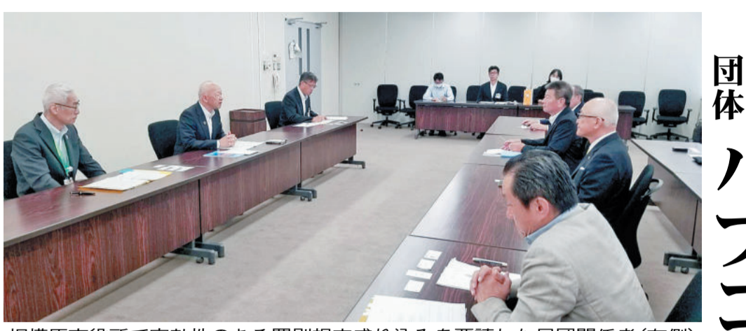
相模原市役所で実効性のある罰則規定盛り込みを要請した民団関係者(右側)＝8月21日

相模原市が17日、市議会・全員協議会で公表した素案は、ヘイト（差別）への罰則規定が削除された。民団関係者は「実効性のある罰則規定の盛り込みを要請する」として、骨抜きの答申に批判的だ。