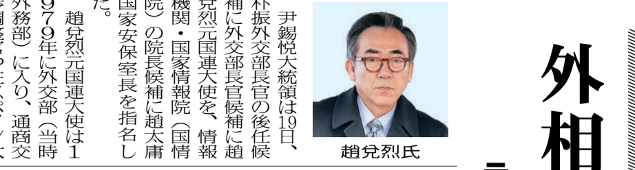
趙兌烈氏 尹錫悦大統領は19日、朴振外相に趙兌烈氏を元国連大使に任命し、外相候補に指名した。趙氏は元国連大使であり、通商問題に精通している。

韓米日の北ミサイル情報共有始動 「迎撃戦略運用が可能に」 防衛省が17日、米、韓、日との間で北ミサイルの情報共有を開始した。これにより、北ミサイルの迎撃戦略の運用が可能になると見られる。