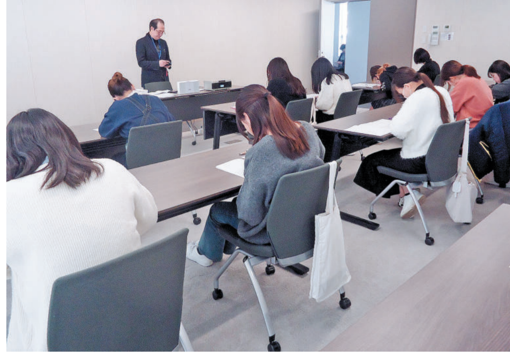
東京の桜美林大学新宿キャンパスに設けられた特設会場で受験する高校生