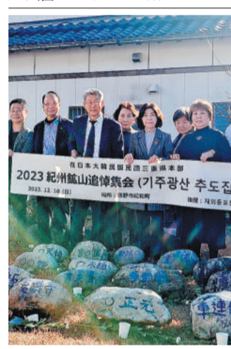
追悼会前で行った追悼式

戦争中に熊野市紀州町の紀州鉱山に徴用された、強制労働の末に亡くなった韓国人労働者を追悼する追悼会が開かれた。追悼式には約200人が参加した。