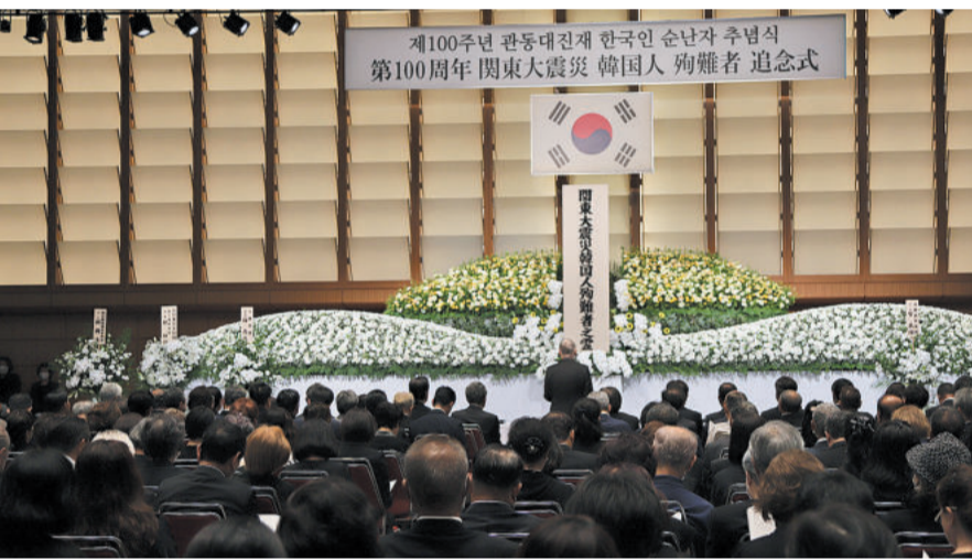
第100周年 関東大震災 韓国人 殉難者 追念式。追念式に参列した在日韓日親善協会代表、民団中央本部代表、在日韓日親善協会代表、民団中央本部代表、在日韓日親善協会代表、民団中央本部代表。